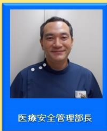
医療安全管理部長

『感染防止』を感染管理室、『医療安全』を医療安全管理室がそれぞれ担当し、院内の危機管理に努めています。