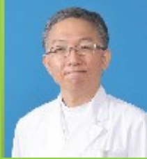
危機管理センター長

『感染防止』を感染管理室、『医療安全』を医療安全管理室がそれぞれ担当し、院内の危機管理に努めています。