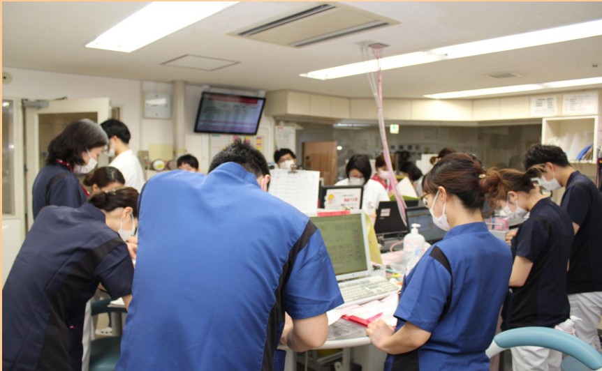
4月の申し送り風景…人がいっぱい！みんな真剣です。

私たちの部署は、呼吸器内科、血液内科、糖尿病・内分泌内科、消化器内科の病棟です。がんの患者さんが多く、化学療法や輸血、麻薬の使用などのイベントが毎日あります。糖尿病内分泌内科で入院された患者さんへの療養支援も行っています。忙しい日々ではありますが、頼もしいスタッフがそろっており、充実した毎日を送っております♪