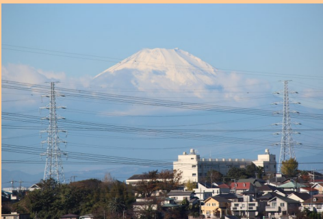
病棟からの富士山