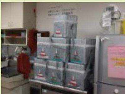
輸血バックのタワー