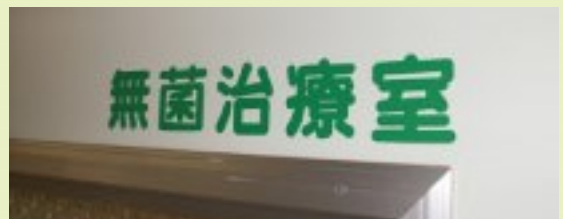
8西病棟には無菌治療室があります。専門的な治療もあって大変ではありますがやりがいがあります！