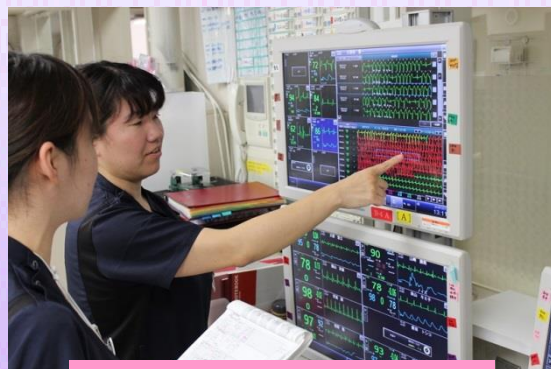
1年目の看護師に心電図の読み方を指導中です。