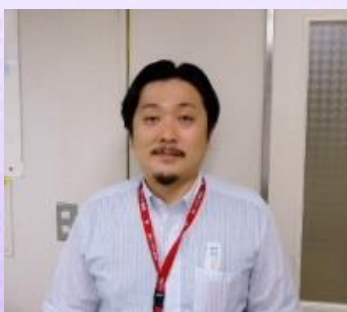
形成外科主任部長代行