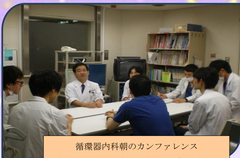
循環器内科朝のカンファレンス チームワークはピカイチ いつもパワフル