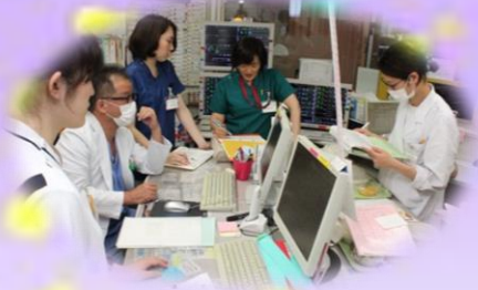
心臓血管外科カンファレンス 週一回、医師と情報共有します

7 西病棟は循環器内科・心臓血管呼吸器外科・形成外科の病棟です。ICU・CCU からの重症な患者さんも多く、目まぐるしい毎日です。そんな中でも「入院したのがこの病棟で良かった」と思ってもらえるような関わりを目標に、スタッフ一丸となり頑張っています。