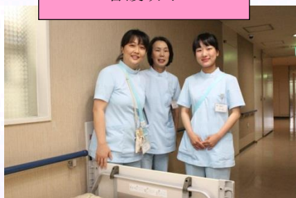
明るく優しく力持ち 看護助手